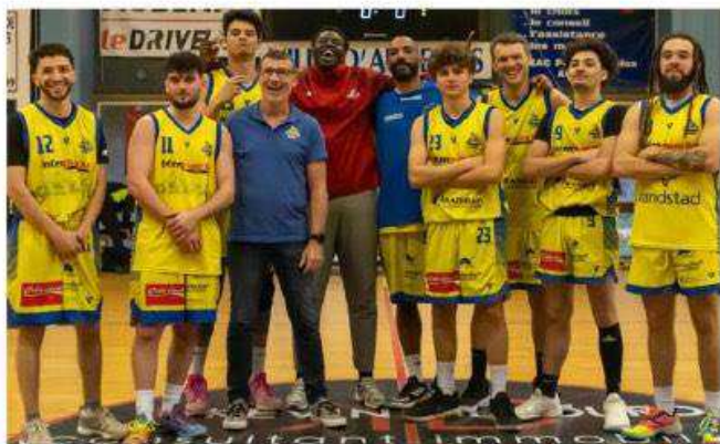
L'équipe a battu le leader 80 à 73.

Cette année, le parcours reste compliqué, notamment à cause d'un effectif réduit. Le groupe est un vrai patchwork: on y trouve des joueurs qui jonglent entre l'équipe fanion et la réserve, d'anciens qui avaient mis le championnat de côté pour le loisir et qui ont retrouvé le goût de la compétition, ou encore des jeunes pousses surclassées... Un mélange hétéroclite mais plein de cœur. Le coach, Denis Murillon, ne s'en cache pas: « On savait que cette saison serait une année de transition. L'objectif, c'était avant tout de souder un groupe et de le cons-