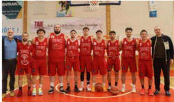
L'équipe fanion masculine régional 3 peut accéder à la régional 2 dès ce soir, samedi 21 mars.