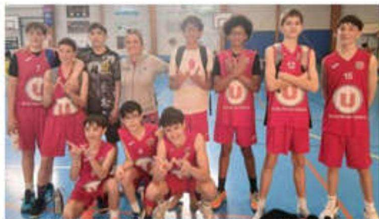
Les U15 vainqueurs face à Saint-Sorlin.

Mantaille Sportif a démontré toute la vitalité de sa formation à travers des résultats variés. Les U11 ont largement dominé Crussol (75-46) tandis que le derby U15 contre Saint-Sorlin Jarcieu Sportif Basket s'est soldé par une victoire serrée (75-69). En revanche, les U13 se sont inclinés face à Saint-Jean-de-Muzols (56-40).