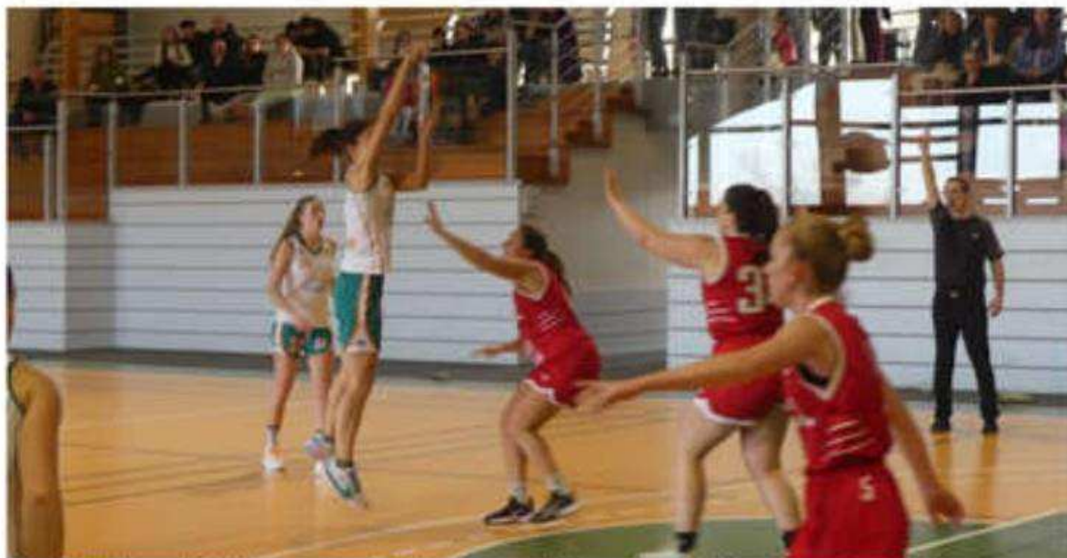
Les féminines du VDB reçoivent Saint-Amour dimanche à 15 h 30.

Pour les deux équipes fanion seniors du Vernosc-Davézieux Basket, le verdict final approche, il ne reste que quatre journées. Dimanche 22 mars, 15 h 30, les filles, menées par Frédéric Lopez, accueillent à Fontas Saint-Amour, classé 5 e , avec deux victoires et quatre défaites, une formation battue à l'aller (76-63). La formation du VDB est première de la