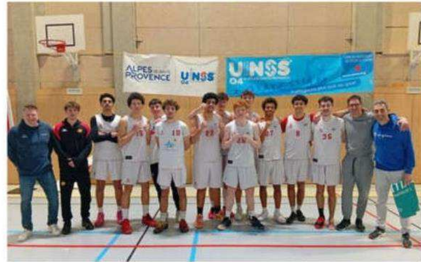
La section basket ramène le titre à la maison pour la première fois.