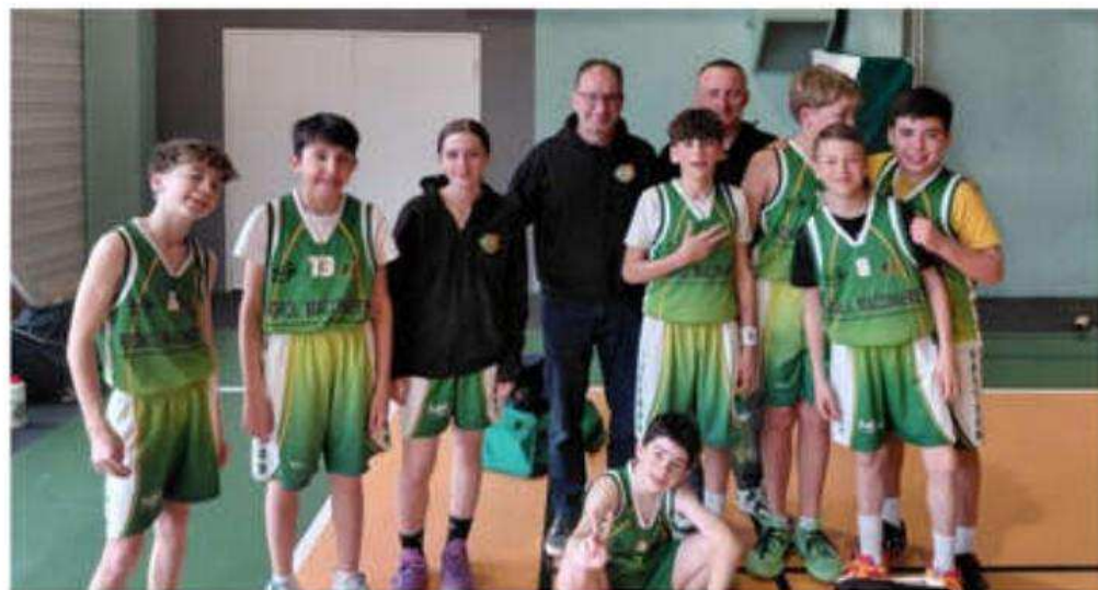
Les U13 garçons du Basket club Anneyron.

Lors de ce dernier week-end de compétition, seule une partie des équipes du Basket club Anneyron (BCA) a su tirer son épingle du jeu.