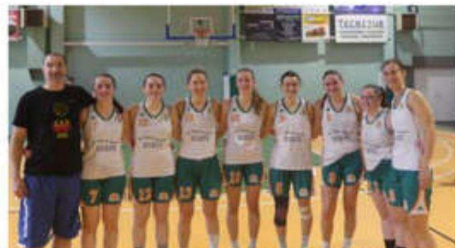
Les seniors filles ne sont plus très loin de la promotion en Prénationale.