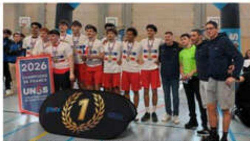
L'équipe de basket du lycée a remporté la finale du championnat de France UNSS Excellence lycée garçons.

Saint-Vallier • Le lycée Henri-Laurens champion de France UNSS de basket