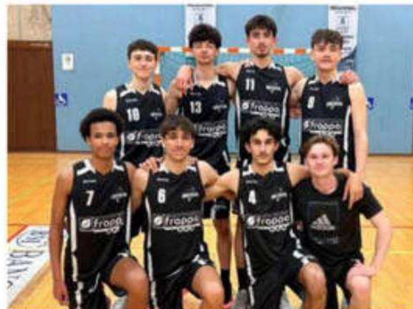
L'équipe U18 masculin du BCNA affrontera celle du SVBD samedi à 18 h 30.

Ce même jour à 15 h 30 l'équipe U18 masculine jouera contre le SVBD. Les deux équipes au coude à coude au classement, avec trois victoires pour trois défaites visent la qualifi-