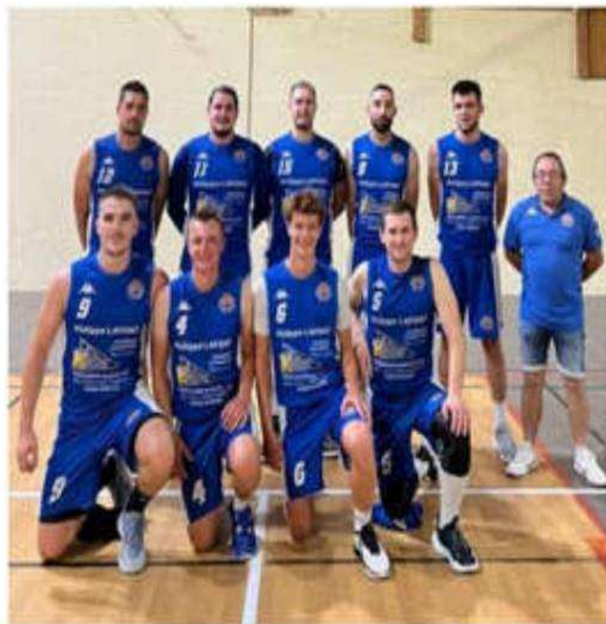
Les seniors, vainqueurs ce week-end.

Les U15 filles 1 en inter-équipe avec le BCNA ont perdu leur match face à l'équipe de La Voulte-sur-Rhône 43 à 44, les seniors garçons 2 se sont inclinés sur le score de 38 à 72 face à l'équipe 2 d'Andance/Andancette et les seniors filles ont perdu leur match face à Mercuroil sur le score de 32 à 61.