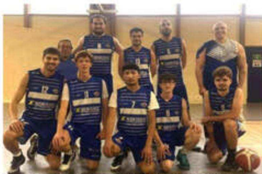
Les seniors 2, vainqueurs à Hauterives ce week-end.

Les seniors garçons 2 sont revenus de Hauterives, équipe 5 e au classement, avec une belle victoire sur le score de 39 à 29. Mais les seniors garçons se sont déplacés à Saint-Péray et ont perdu leur match sur le score de 57 à 69, les seniors filles ont joué un match serré à Saint-Sorlin et se sont inclinées sur le score de 40 à 48, puis les U15 filles en interéquipe avec le BCNA (Basket club Nord Ardèche) ont perdu leur match décalé contre Vernosc Davézieux basket (43 à 71).