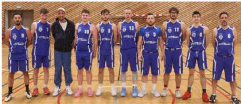
Les seniors III (D3) vainqueurs du derby face à Tain-Tournon IV.

Samedi 14 mars, les seniors masculins III (D3) du Basket Club Mercuriol Chanos-Curson (BCMCC) d'Adrien Fickinger se sont imposés sur le club voisin de l'Avant Garde Tain-Tournon Basket Club IV d'Eric Rochart.