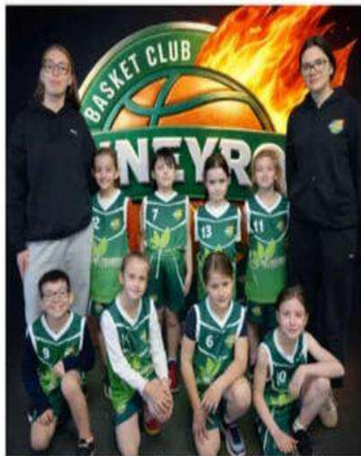
Les U9 du BCA se déplaçaient à Saint-Sorlin-en-Valloire pour un plateau.

À l'extérieur, les équipes U11F et U13F joueront respectivement contre Saint-Vallier Basket Drôme et CTC Porte de Drom-Ardèche (13 h), les U15 filles se déplaceront à Saint-Sorlin Jarcieu Sportif Basket (18 h).