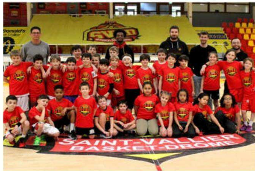
Les participants au stage d'hiver.

Le Saint-Vallier basket Drôme a organisé un stage hivernal lors de la première semaine des vacances scolaires. L'occasion de revenir sur les activités faites par les U9, U11 et U13-U15.