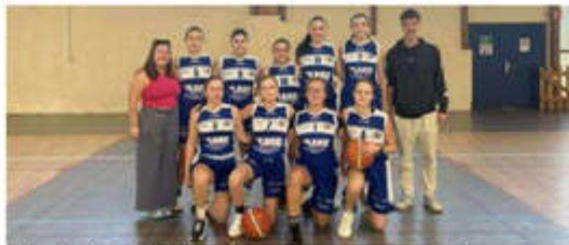
L'équipe des U18 filles, victorieuse pour sa part face à Hauterives (43-40)

L'équipe I des U15 filles en interéquipe avec le BCNA (Basket club nord Ardèche) a remporté son match contre Vernosc-Davézieux (60-46), les U18 filles en interéquipe avec Deume ont également gagné face à Hauterives (43 à 40). Mais les seniors femmes ont perdu face à Rhodia, équipe invaincue de la poule, (28 à 71), l'équipe deux U15 filles en interéquipe avec le BCNA a perdu (38-48) contre Bourg-de-Péage, les seniors garçons se sont eux aussi inclinés face à l'équipe deux de Mer-