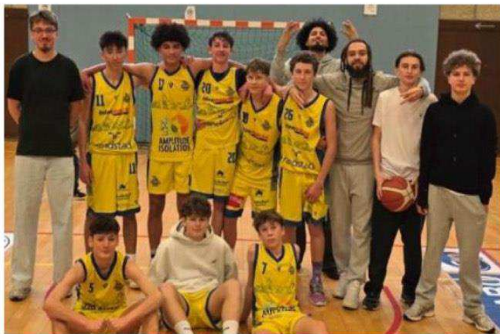
L'équipe U18 (2) de l'USAB monte en puissance.

L'intégration dans un club, ça n'a pas d'âge! La preuve avec l'équipe U18 garçons 2 de l'USAB, qui a remporté son match le dimanche 18 janvier contre Le Cheylard. Ce qui est frappant, c'est la composition du groupe: sur une dizaine de joueurs, seulement quatre sont issus des rangs du club.