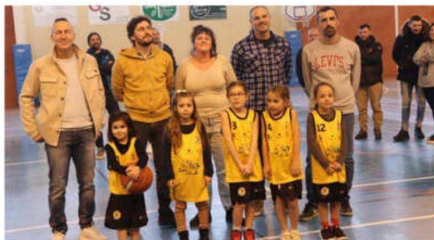
Une des équipes avec ses maillots, entourée des sponsors et encadrants.