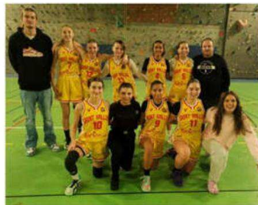
Les U18 filles du SVBD rencontreront la Voulte.

En déplacement : les U11 garçons 1 à Sud Drôme (10 heures), les U11 garçons II à Eclassan, les U9 garçons en plateau à Andance, les U9 filles en plateau à Chavanay (13 heures), les U11 garçons III à Mantaille (14 heures), les U13 garçons II DM2 à Vernosc-Davézieux