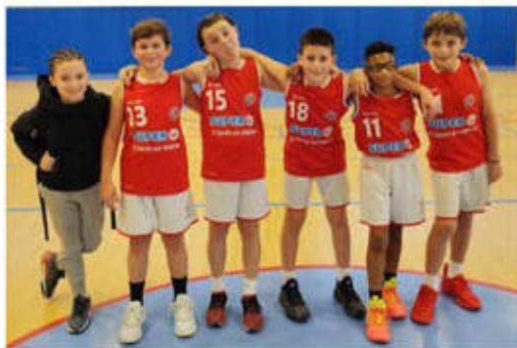
Les U11 ont brillé face à Saint-Jean-de-Muzols.

Dimanche, les U21 A ont battu Ozon (77-70). En seniors, l'équipe fanion a perdu de justesse contre Villefranche-Beaujolais d'un point, malgré des performances inégales aux lancers francs. Les seniors II ont dominé Aubenas (100-79),