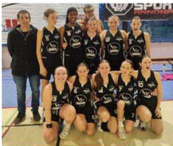
Les U15 féminines s'imposent (60-46) face à Vernosc-Davézieux basket.