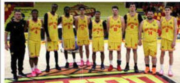
Les seniors III vainqueurs d'Échirolles.

En championnat départemental, victoires des U18 garçons IV à Valence Bourg