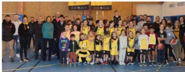
Lors de cette rencontre mettant à l'honneur tous ces jeunes, sponsors et celles et ceux qui œuvrent au bon fonctionnement de ce club de basket.

Avec 105 licenciés répartis sur 9 équipes, ce club de basket créé le 13 mai 2021 connaît une formidable progression et fait parler de lui lors des rencontres en Drôme-Ardèche. Retour sur sa création et cette seconde saison.