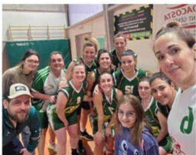
Les seniors féminines 1 (PRF) ont réussi à s'imposer avec une belle victoire contre Mercuriol Chanos-Curon BC.

► Dans un premier temps, les équipes féminines UIIF et UI3F ont réalisé des performances impressionnantes. L'équipe UIIF a obtenu une victoire significative contre Saint-Vallier Basket Drôme (50-36). Cette victoire souligne le travail acharné et la bonne cohésion de l'équipe, qui continue de progresser au fil des matchs. De même, l'équipe UI3F (R2) a triomphé (57-46) contre IE CTC Porte Drôme-Ardèche - Saint-Vallier Basket Drôme, consolidant ainsi sa position dans le championnat. ► Les jeunes garçons de l'équipe UI3M (D2) ont également su se démarquer en remportant leur rencontre contre Vernosc Davézieux Basket (52-