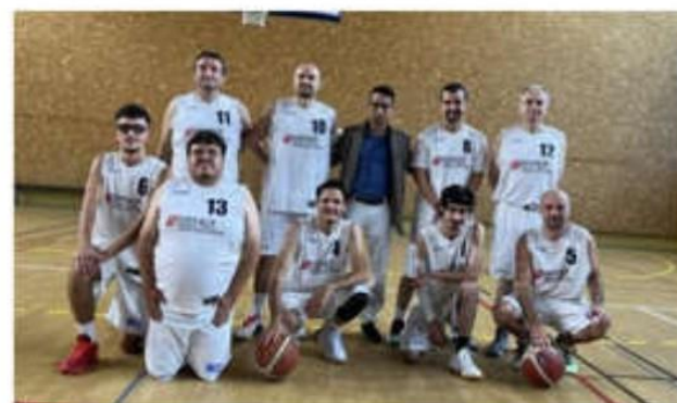
Pour ce dernier match à domicile, l'équipe réserve des seniors garçons est passée près d'une belle performance.

Lourde défaite des seniors masculins (1) face à la solide formation du Teil 53 à 85. L'entame fut pourtant idéale avec un joli 12 à 5, mais bien vite les visiteurs vont prendre la main sur le match. Le deuxième quart-temps tourne à la le-