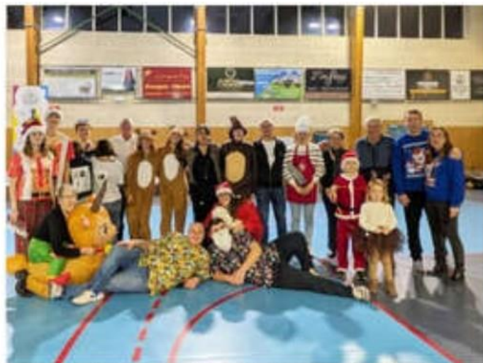
Les participants au concours du meilleur binôme de Noël.

Deux chanceux sont partis avec une bonbonnière débordante de bonbons grâce à la tombola du matin et du soir. Un concours du meilleur binôme de Noël était également organisé. Cette année, les organisateurs avaient innové avec "le duo iconique" et la formule: "Tu viens en binôme, en paire, en dipôle, appelle ça comme tu