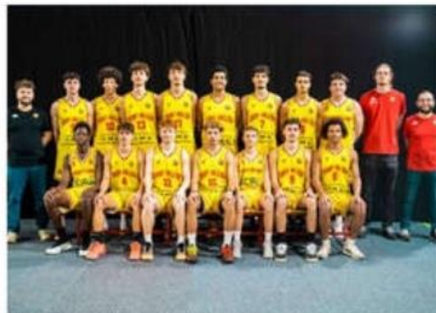
L'effectif complet des U18 Élite du Saint-Vallier Basket Drôme, pour la saison 2025-2026.