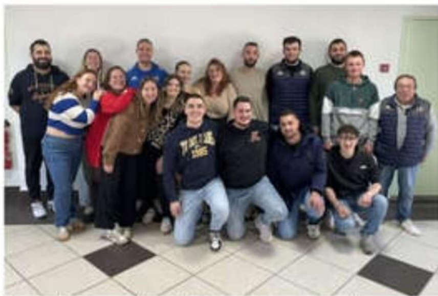
De nombreux membres de Vanau Sport ont permis l'organisation de la matinée sauté de porc.

Les bénéfices permettront de financer les frais de fonctionnement du club. Une belle action menée par toute l'équipe des responsables de l'association, pour fêter cette fin d'année.