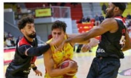
Les joueurs du SVBD ont été très malmenés dans le Nord.

Débordé par ferveur et la fougue de Loon-Plage, le SVBD a pris une leçon contre un de ses rivaux pour la poule haute (101-59). Il s'agira de vite rebondir contre les grosses écuries du Havre et de Fos Provence avant la fin de l'année.