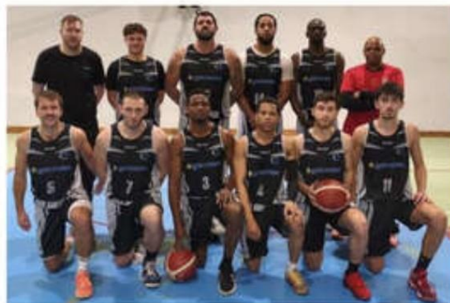
L'équipe première masculine du BCNA a tenu tête face au leader, Saint-Martin-d'Hères, mais a fini par s'incliner.

L'équipe première masculine du Basket club Nord-Ardèche (BCNA) s'est inclinée à domicile, 63-75, contre Saint-Martin-d'Hères, samedi 13 décembre. Bien que les deux équipes sont restées au coude-à-coude tout au long du match, le money time aura été fatal aux Nord-Ardéchois.