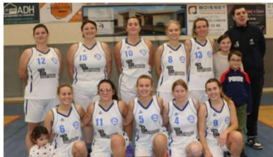
Les seniors féminines II (D3) juste après le match face au leader Eclassan II.

Ce week-end, les équipes du BCMCC étaient sur les parquets dans leur championnat respectif.