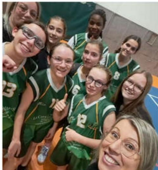
Les U15 filles se sont illustrées en dominant Châteauneuf-sur-Isère BC avec une victoire écrasante de 88 à 58.

Dans la catégorie U18, les résultats ont été moins prometteurs. Les filles ont subi une défaite contre Saint-Sorlin Jarcieu sportif, avec un score de 35 à 62. Malgré cette défaite, il est crucial de rappeler que la saison est encore longue et que chaque match apporte son lot d'enseignements. Les garçons U18, quant à eux, se sont inclinés de justesse face à Saint-Valier basket Drôme, avec un sco-