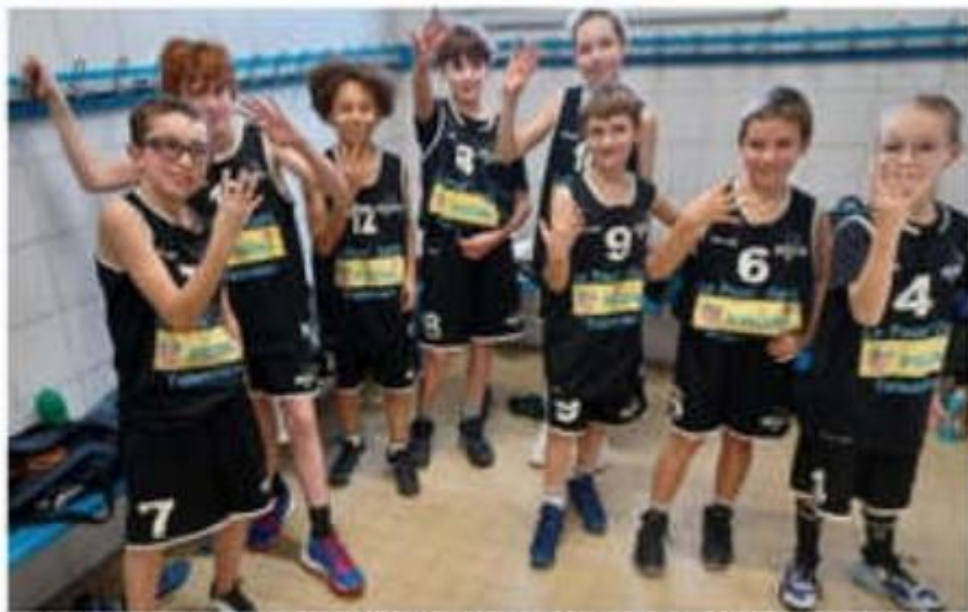
Match au sommet entre les équipes U13M du BCNA et celle de Mantaille, coleaders du championnat.

L'équipe senior féminine se rendra à Saint-Jean-de-Muzols, dimanche 14 décembre à 13 heures, avec l'espoir de re-