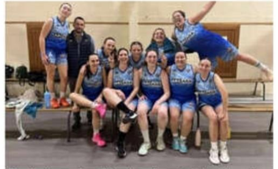
L'équipe des seniors filles, victorieuse de Saint-Pierre-de-Bœuf (39-31).

Les équipes du Vanau sport basket étaient sur le pont samedi 13 et dimanche 14 décembre. Les seniors filles ont gagné (39-31) face à l'équipe de Saint-Pierre-de-Bœuf, pendant que la réserve des seniors garçons a battu celle de Portès-les-Valence (59-42) et que les seniors garçons l'ont emporté face à Privas (76-42). Victoire également pour les U15 filles en interéquipe avec le BCNA (Basket club Nord Ardèche), 71 à 68 face à Tain-Tournon. Seule l'équipe deux des U15 filles en interéquipe avec le BCNA a connu la défaite (43-55) contre Saint-Sorlin - Jarcieu.