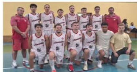
L'équipe de Mantaille Basket, invaincu cette saison, espère bien retrouver la Nationale 3.

Sur le terrain, l'effectif, quasiment inchangé, est un véritable rouleau compresseur avec sept victoires en sept rencontres. Et surtout, un écart moyen de + 21,5 points. « On a une équipe encore plus forte que l'an dernier. Une équipe qui était ailée chercher 13 victoires en N3 », rebobine le technicien drômois. « On a vraiment une profondeur d'effectif très intéressante avec deux 5 majeur quasiment interchangeables. Lors de notre victoire à Pontoise le 15 novembre (56-74), mon deuxième cinq