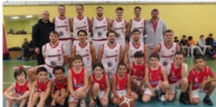
Les jeunes U11 de l'école de basket en appui de l'équipe fanion des seniors I.