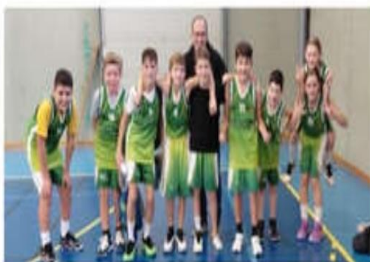
Les U13 garçons invaincus.

Ce week-end a révélé la détermination exceptionnelle des U13 filles et garçons du Basket club d'Anneyron, qui maintiennent leur série de victoires impressionnante. Leurs performances remarquables (49-45 contre Aubenas US et 79-59 contre Chantemerle) démontrent le potentiel extraordinaire du club. Bien que les autres équipes aient connu des défaites, l'esprit de résilience reste intact. Les dirigeants croient fermement en leurs talents et en leur capacité à rebondir.