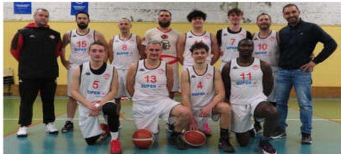
Les seniors III victorieux de Portes-lès-Valence USC I.

Samedi 15 mars au gymnase Marcel-Magnan, en lever de rideau, les seniors III DM.2 étaient opposés au 5 e de la poule A Portes-lès-Valence USC I.