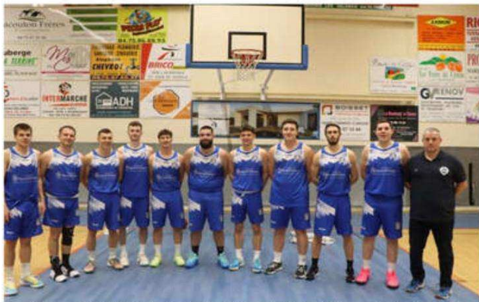
Samedi 15 mars, à 20 h 30, l'équipe fanion Régionale 3 du BCMCC aura besoin du soutien de ses supporters pour dominer le leader Eveil Lyon.

Dimanche 16 mars, à 11 heures, au gymnase du collège, les seniors III masculins du championnat D4 (poule haute)