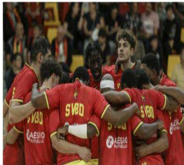
Saint-Vallier reste sur une série de trois défaites de rang dans la poule haute.