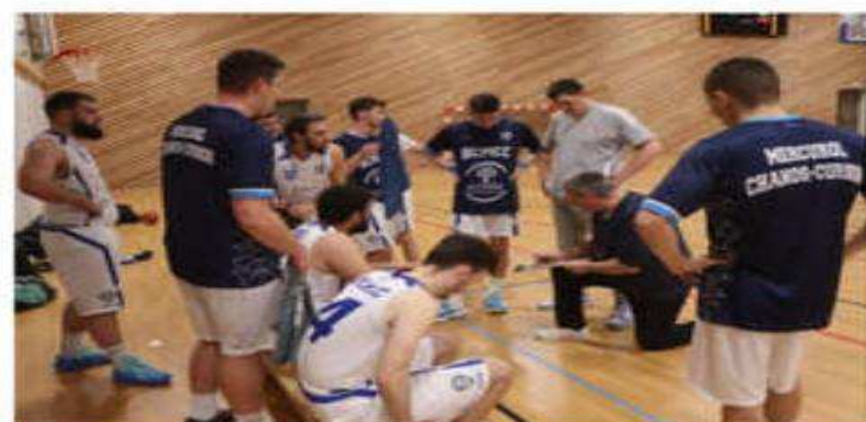
Face au leader invaincu, le BCMCC a échoué dans les dernières minutes du match.