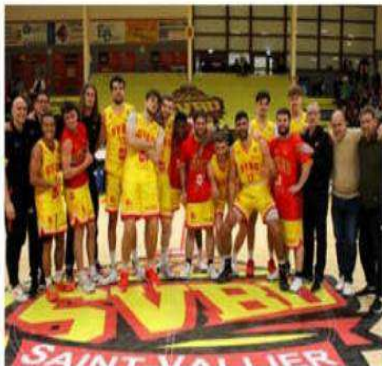
La réserve du SVBD après sa victoire importante contre Beaujolais début mars.

Tout pourrait se jouer sur les quatre prochaines semaines. Saint-Vallier reçoit trois équipes de la deuxième partie de tableau, qui pourraient bien être