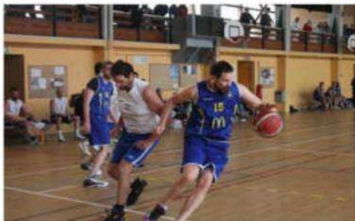
L'équipe première du BCC (Basket Club Cheylarais) peut encore mathématiquement accrocher la 4 e place qualificative pour les demies finales.

Malgré une bonne partie d'ensemble, les joueurs locaux ont dû subir la loi de plus fort. Les locaux ont pu y croire jusqu'à la mi-temps, soldée par le score de 35 à 45, mais après la pause, l'adresse diabolique des adversaires a fait