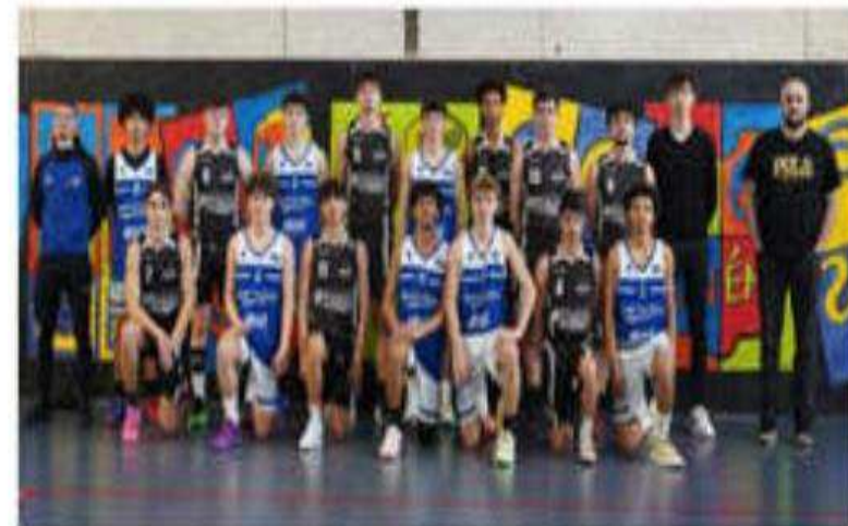
L'équipe U18.M du BCNA, victorieuse de Montélimar 86-49 le week-end dernier, s'est qualifiée pour la finale de la coupe Drôme-Ardèche.

Les matchs du samedi 15 mars, à domicile : Bourg-de-Péage - DMU11 à 12 h 15 ; DFU13.3 -