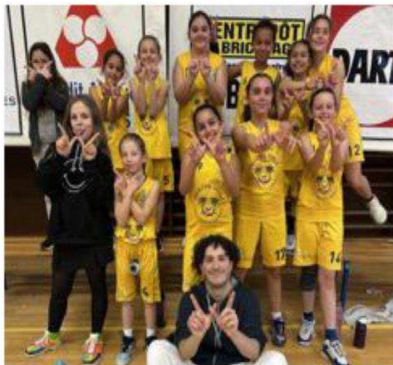
Le groupe des U11F en constante progression.