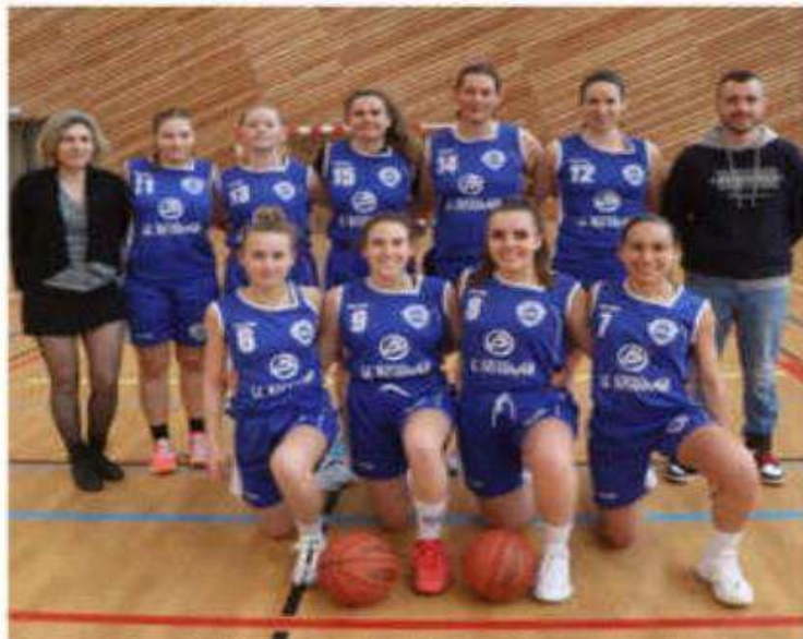
L'équipe fanion féminine de Kévyv Maisonneuve juste avant le derby face à Châteauneuf-sur-Isère II.

▶ En déplacement : les U11 filles I ont perdu chez la CTC Drome-Saulce d'un point (36-