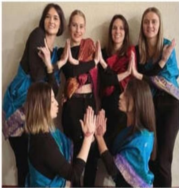
Les seniors filles en provenance d'Inde, lors de la soirée déguisée du 22 février.

Le rendez-vous est d'ores et déjà donné au public pour assister aux tournois de pétanque et de basket, les samedi 14 et dimanche 15 juin.