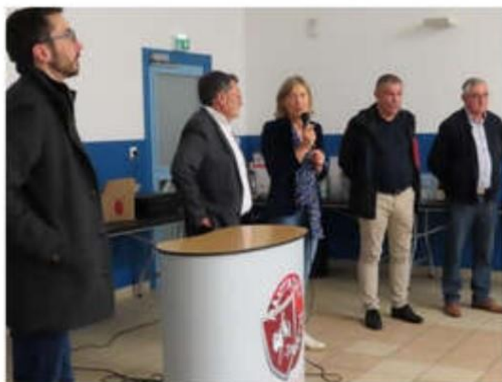
Les élus ont salué les dirigeants et bénévoles de Mantaille sportif.

Les entraîneurs sont souvent dans la nécessité d'utiliser d'autres gymnases, notamment celui d'Albon. Depuis peu un minibus est à disposition des joueurs. « Je suis un président heureux et fier de représenter