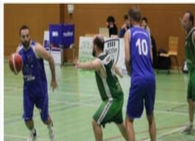
L'équipe réserve est en quête du maintien pour cette seconde partie de championnat.

Même scénario pour l'équipe réserve, qui opère en