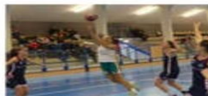
Victoire des seniors filles qui entament bien la 2 e phase.

Basket : les seniors du VDB débutent bien 2025