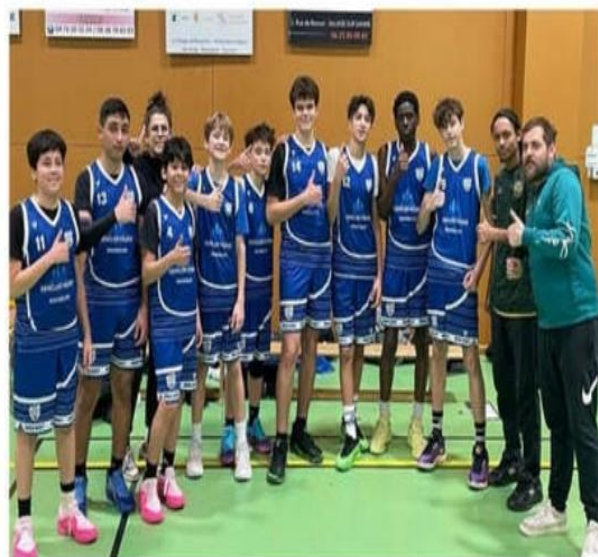
Les 15 ans garçons A se sont qualifiés en Régional 3 à l'issue de la première phase de championnat. Ils se rendront à Bourg-en-Bresse ce samedi.

C'est le nombre de licenciés au Rhodia basket. Une légère baisse des effectifs due à la disparition d'une équipe féminine et de la section du baby-basket.