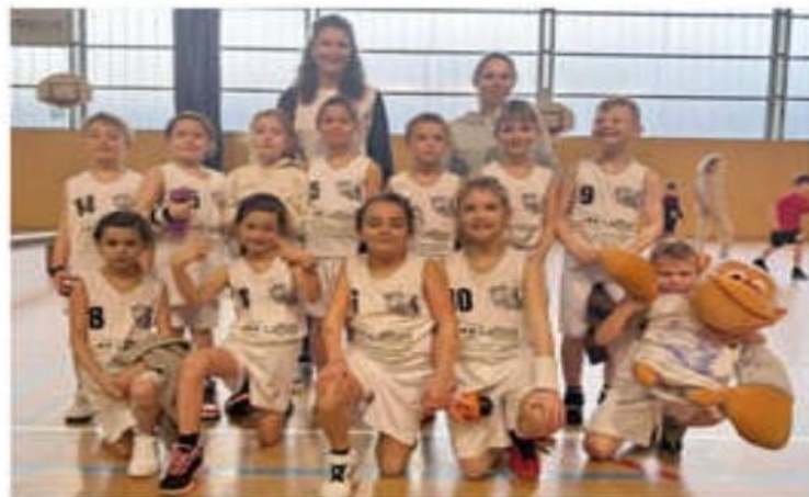
Les U9 du BCC qui ont accueilli Vernoux, Privas et La Voulte en plateau.

Superbe performance toutefois des seniors masculins 2 à Saint-Sorlin, où ils se sont inclinés de peu, 40 à 37. Le résultat est assez frustrant, mais aussi très encourageant après les « raclées » de la première phase. Le 1 er quart-temps s'est