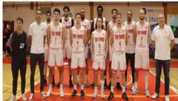
L'équipe fanion veut rester invaincue sur le parquet du chaudron Fernand-Chapelle.