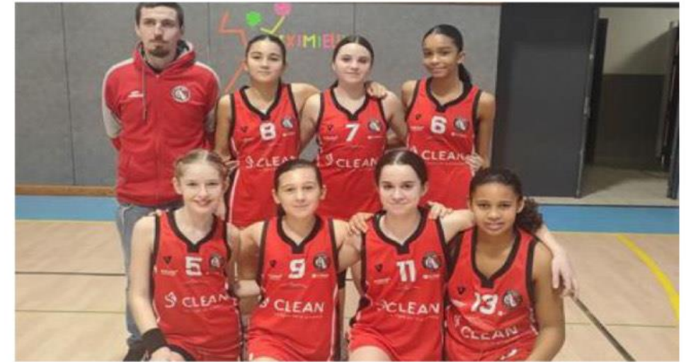
L'équipe A des moins de 13 ans s'est largement imposée à Meximieux sur le score de 45 à 28.