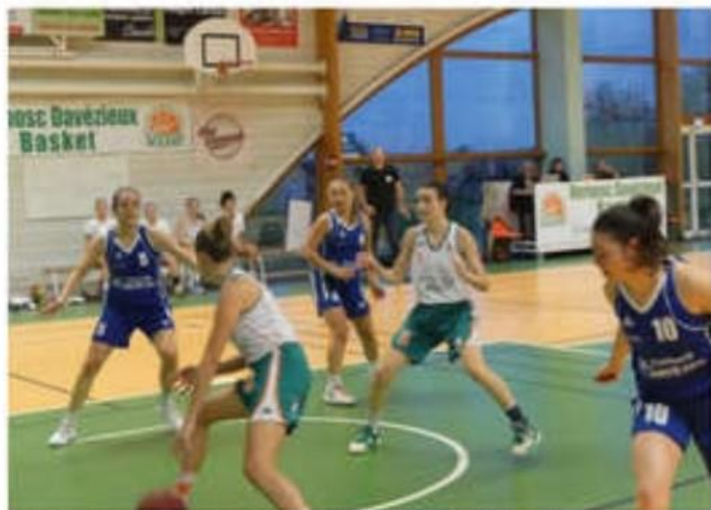
Les seniors femmes entament la deuxième phase du championnat en poule haute.

Les seniors féminines, dans la poule haute en Régionale 3, recevront Francheville, ce dimanche 12 janvier à 15h30, à Fontas. Les deux formations ont terminé ex aequo mais les Franchevilloises ont