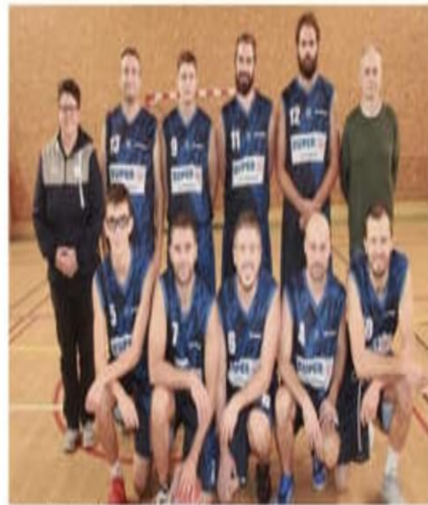
L'équipe fanion du BCC se lance dans un nouveau championnat ce week-end.

Côté féminines, les seniors 1, en départementale 2 ne reprendront le championnat que le 25 janvier. Ce samedi 11 janvier, les U15 filles se déplacent à Montélimar pour 14 heures.