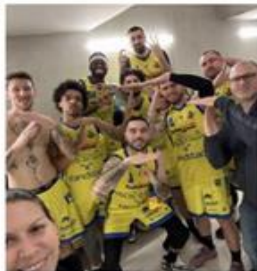
La joie de la victoire dans le vestiaire des Albenassiens.