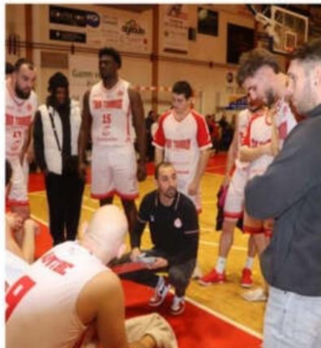
Le groupe de l'AGTTBC a fait plaisir à son public.