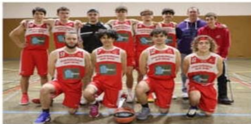
Les U21 région reçoivent dimanche Mantaille.

En déplacement : à 13 heures, les U15 garçons 1 vont à Génissieux/Romans ; à 17 heures, l'équipe fanion masculine Régional 3 (poule haute) de Stéphane Degiron joue à Ville-la-Grand ; à 17 h 30, les seniors masculins II (26/07) à Crussol.