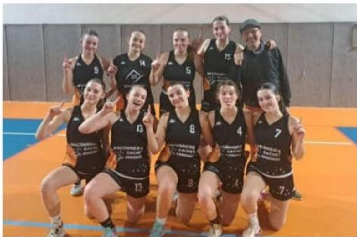
Invaincu en championnat et qualifié pour la poule haute, le collectif senior féminin est la grande satisfaction de cette première partie de saison.

« En fin de saison dernière, la volonté du club a été de remonter une équipe senior fé-