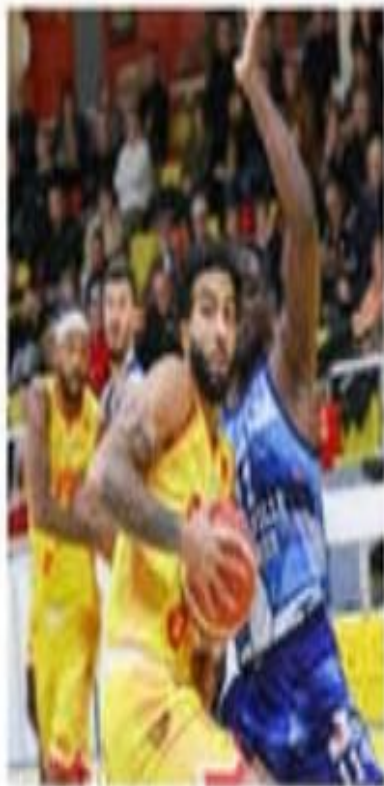
Saint-Vallier a encore toutes ses chances d'accéder aux play-offs.

offs. Avec la dynamique actuelle, il est possible d'espérer un spectaculaire redressement du SVBD. Il reste encore neuf matches à jouer pour se positionner dans les sept premiers. Sur ces neuf rencontres, les Drômois vont affronter six équipes qui sont derrières ou à égalité avec eux, avec cinq matches à domicile. De quoi imaginer un retour au premier plan au printemps prochain.