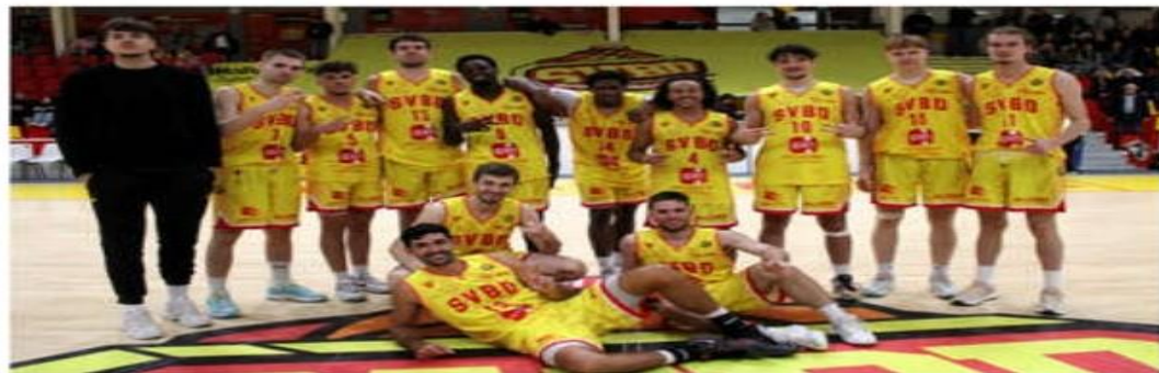
L'équipe Nationale 2 masculine.

À mi-saison, nous vous proposons un bilan de toutes les équipes de UB à seniors du Saint-Vallier Basket Drôme.