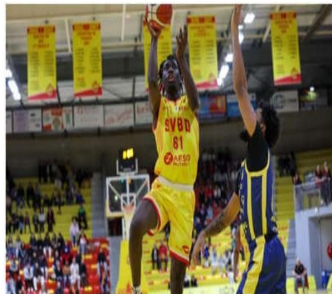
Saint-Vallier et Siméon Kalemba ont logiquement dominé leurs voisins vauclusiens.

De leur côté, les Avignonnais, plus éreintés physiquement en fin de match (cinq joueurs à plus de 25 minutes), avec seulement quatre joueurs sur le banc, ont payé leur manque d'adresse, notamment en première mi-temps (36 % au shoot). Adresse guère mieux (16/36) chez les hommes en jaune, en revan-