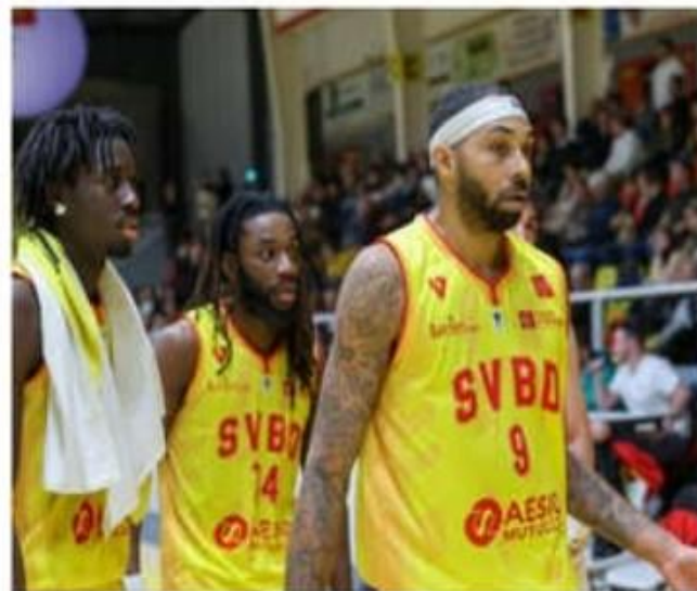
Le SVBD s'est incliné en toute fin de rencontre.

En rehaussant tous les curseurs défensifs, le SVBD faisait mal à l'ensemble havrais, en panne de solutions. Une accé-