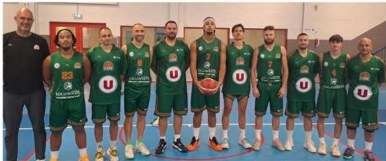
Après un début de saison médiocre, les seniors garçons du VDB espèrent bien rebondir en seconde phase.

En cette saison 2024-2025, les seniors garçons du Vernosc Davézieux Basket vont, dès le 11 janvier prochain, intégrer la poule basse de Régionale 3 après leur 3 e place de la première phase.