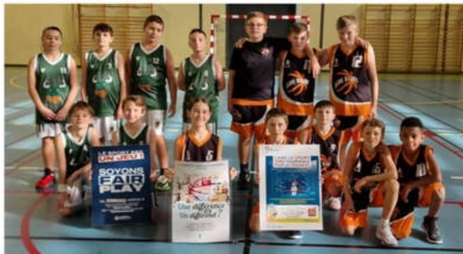
Les U13 garçons.

Pour accompagner cette belle dynamique, le club a pris la décision d'embaucher un apprenti BPJEPS (Brevet profes-