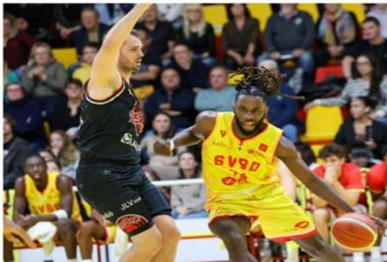
Les joueurs de Saint-Vallier se sont effondrés dans le deuxième quart-temps et la défaite semblait déjà se dessiner au retour aux vestiaires.

Dès le début du deuxième quart-temps, Saw partait à l'assaut du panier adverse pour creuser l'écart et c'est Alain sur deux lancers francs qui permettait de passer la barre symbolique des 10 points d'avance (13 e ). Le