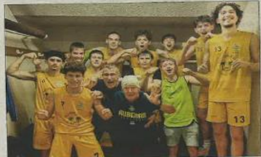
Les U18 Garçons.