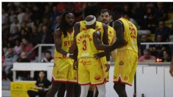
L'intégralité de la formation du SVBD était au rendez-vous ce vendredi.

Un succès construit dans l'engagement, recherché par le technicien franco-américain, mélangé à la rigueur. Les Drômois, menés seulement 15 petites secondes dans la partie, n'auront pas tremblé, s'of-