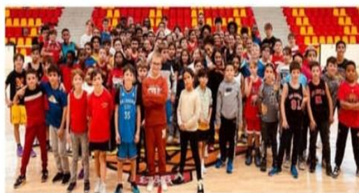
Les U9, U11, U13 et U15 ont profité du camp d'automne du club de basketball de Saint-Vallier.

Le Saint-Vallier basket Drôme (SVBD) organisait, durant la première semaine des vacances de la Toussaint, son "training camp d'automne". Ce dernier s'est déroulé du lundi 21 au mercredi 23 octobre pour les U9 et U11, et du mercredi 23 au vendredi 26 octobre pour les U13 et U15.