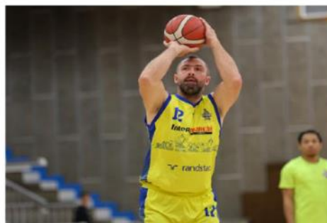
L'US Aubenas Basket s'est imposée à domicile.