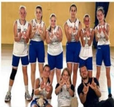
Les U15 de Paul Lehericy continuent l'aventure en coupe.

Match à suspense et joli dénouement pour les joueuses U15 filles de Paul Lehericy, qui finissent par s'imposer face à Andance 55 à 49. Tétanisées par l'enjeu, les jeunes filles, méconnaissables, sont menées à la pause 16 à 23. Laisant la pression de côté, elles montent en intensité et grappillent les points. À l'entame du dernier quart, le retard n'est plus que de deux points. Elles parviennent à l'emporter en maîtrisant au mieux la fin de match, cela au grand soulagement des supporters, qui ont mis une bien belle ambiance.