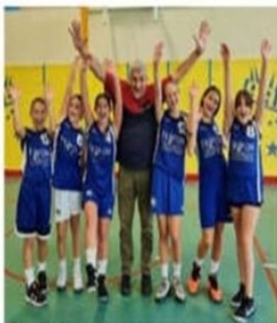
Les U13 filles fières de leur belle victoire face à Saint-Sorlin.

Le club de basket Andance-Andancette remporte deux victoires sur les trois matches du week-end en coupe Drôme-Ardèche. Les U15 filles se sont battues sur le parquet du Cheylard.