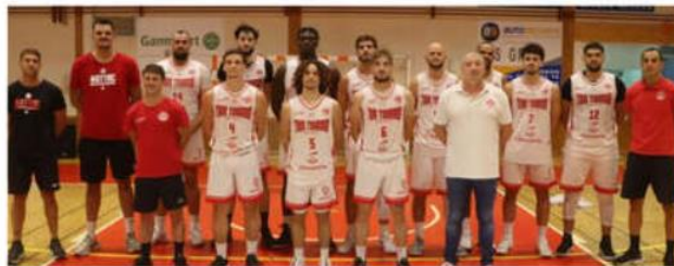
L'équipe de l'AGTTBC N 3, juste avant le rencontre.

Les visiteurs ont remporté le premier quart-temps, 27-19 puis le second 28-21 pour mener à la pause de 15 points, 55 à 40. Le troisième quart-temps est plus équilibré, 24-22 pour