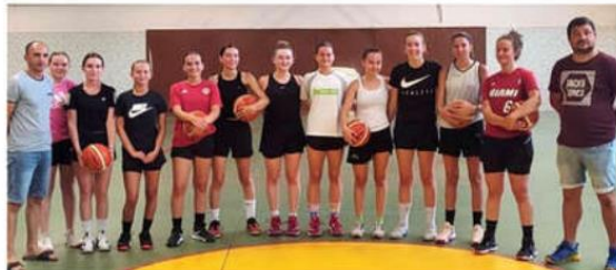
Les basketteuses U18 filles, accompagnées de quelques seniors, ont repris les entraînements à la fin du mois d'août.

Presque toutes les catégories seront a priori représentées au sein du club : U7, U9 et U11 mixtes, U13M et U13F, U15F, U18F, U18M, U18F, seniors M1, M2 et loisirs, seniors féminines championnat et loisirs. Quatre équipes fonctionneront en entente avec Annonay ou Bourg-Argental : les U13M, U13F, U15F et U18M. Les U15M masculins seront la seule catégorie non représentée. À noter le maintien des sec-