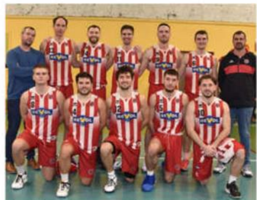
Mantaille repartira avec un effectif quasiment identique avec un départ et une arrivée.