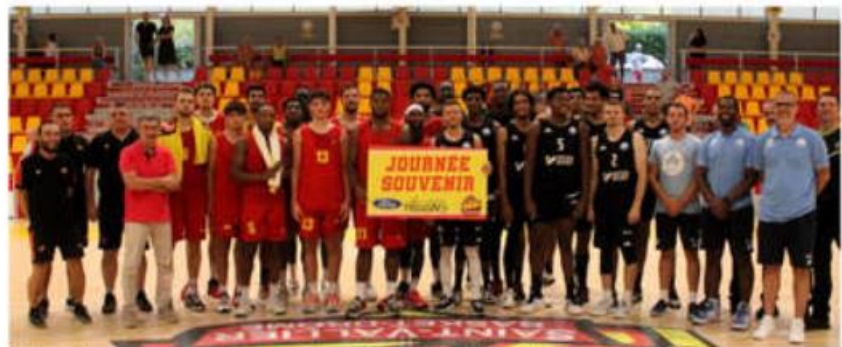
Dimanche 8 septembre ce sera la journée souvenir du club.

Ce dimanche 8 septembre, le SVBD lance sa saison avec sa traditionnelle journée souvenir en hommage à ses anciens dirigeants au complexe des Deux Rives. À 10 h 30 seniors filles affronteront Eclassan ; à 10 h 30 U18 garçons II contre Terres Froides ; à 12 h 45 U18