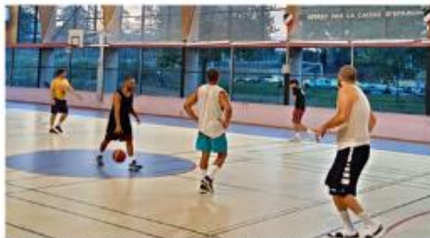
Les joueurs ont repris l'entraînement.

Les entraînements de l'équipe première du Basket club Nord Ardèche ont repris depuis lundi 19 août sous la houlette de Nicolas Curtil et Christian Maurin au rythme de deux entraînements par semaine. Le collectif nord ardéchois évoluera dans le pool F du championnat de Pré-nationale et aura pour adversaires Saint-Hippolyte Basket, Aulnois US, Amicale BC Domène, Les Falcons de Pagnan et l'Étoile Saint-Denis qui les accueillera le 11 septembre. Le samedi 20 septembre pour la première journée de championnat. D'ici là, plusieurs matches amicaux sont planifiés contre l'équipe 3 de Saint-Vallier et Francais Uniers avant le premier tour de la coupe de France le samedi 18 septembre sur le parquet de la CRD Lyon.