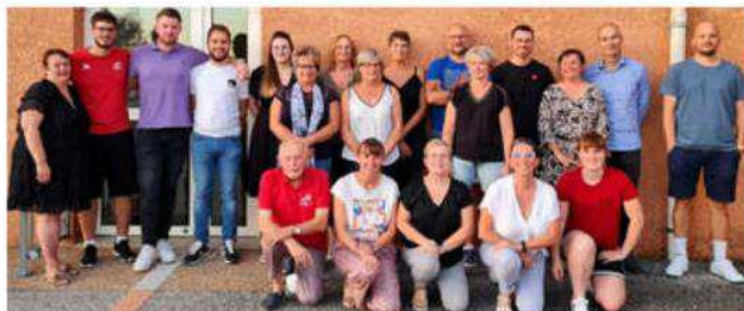
Le conseil d'administration 2023.

Le BCC ce sont près de 300 licenciés et 19 équipes allant de l'Éveil basket au Basket santé, des entraîneurs qui exercent leur rôle avec sérieux, 35 arbitres, parfois chahutés pourtant indispensables au bon déroulement des matchs. Mais ce sont aussi les diverses manifestations organisées au cours de