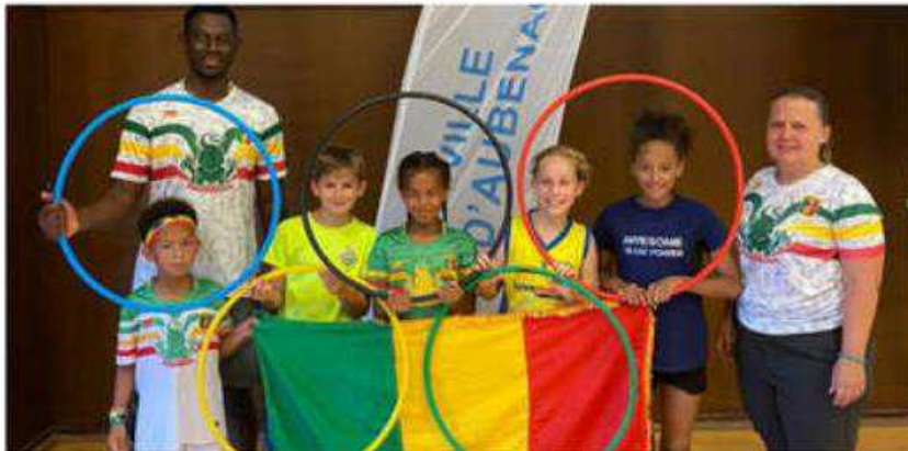
Des jeunes tous très motivés pour cette journée de clôture.

Moment plaisant et convivial vendredi soir à la halle des sports à l'occasion du tournoi des familles de l'US Aubenas basket, venu clôturer une belle