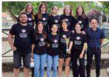
L'équipe U18 féminine est la plus forte de la saison, avec le titre départemental de D1.

L'Ente sportive de Saint-Marcel (ESSM) a effectué son bilan 2023. Le fait principal est une augmentation de 24% des effectifs de 24%, passant de 120 à 149 licenciés. Cette augmentation est sans doute due à diverses aides financières, mais aussi aux actions de promotions effectuées par le club, notamment auprès des jeunes.