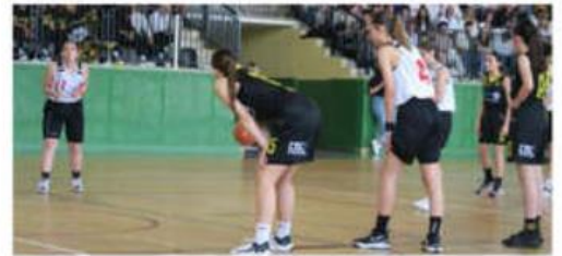
Les finalistes des coupes Drôme Ardèche ont livré de belles performances à Portes-lès-Valence.

Le spectacle était au rendez-vous lors de la finale des séniors masculins qui opposait le Basket Club Châteauneuvois (BCC) contre l'équipe de Tain/Tournon IV. Parti avec 21 points de retard, le BCC a augmenté la cadence après la première mi-temps (45-59). Les hommes de Stéphane Degeron ont pris l'as-