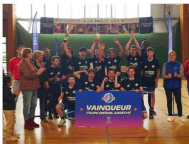
Le club de Rhodia réalise le doublé en remportant la Coupe Pierre Leleu en U15 Masculins et la Coupe François Dufour en U17 Masculins.

La présence de nombreux supporters et des élus locaux