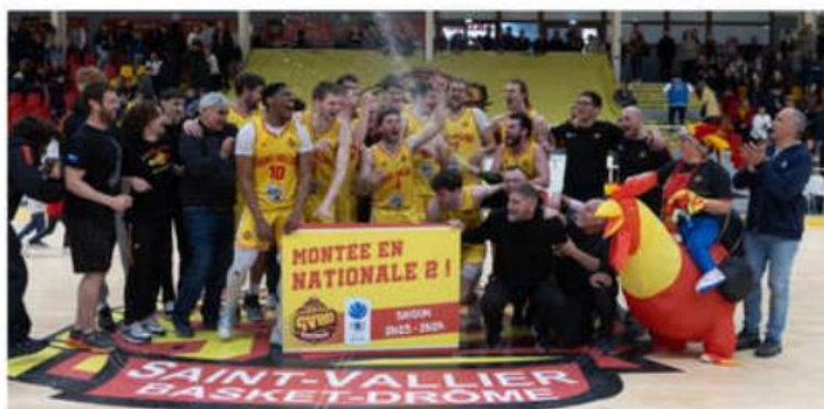
La montée pour la réserve de Saint-Vallier en Nationale 2.

Ce cocktail est inhabituel pour un match de Nationale 3, qui plus est lorsqu'il s'agit d'une équipe réserve. Mais il faut constater que tout est « exceptionnel » dans cette équipe de Saint-Vallier.