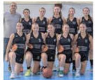
L'équipe UISF du BCNA a battu Éclassan en finale.

Chez les jeunes, Rhodia réalise le doublé ce dimanche avec la victoire des équipes masculines, U15 et U17. Le Basket Club Châteauneuf (BCC) repart avec une deuxième coupe remportée haut la main par les U15 féminines, qui n'ont pas tremblé face à Saint-Sorlin. Chez les féminines toujours, le Basket Club Nord Ardèche (BCNA) arrache la coupe à Éclassan (EOE) qui menait la danse en première mi-temps (34-30) dans la catégorie des U18. En U13, les masculins de Mantaille sortent également le grand jeu à la suite d'un duel serré face à Saint-Sorlin. Le week-end s'est achevé sur une victoire des U13 féminines de Montélier face à La Voulté.