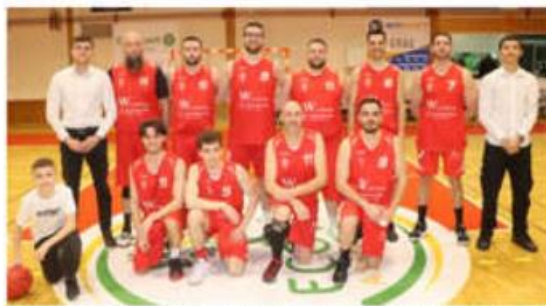
Les seniors IV (D5) de l'AGTTBC jouent ce soir, la finale de la Coupe Drôme-Ardèche contre Châteauneuf-sur-Isère I (DI).

Dimanche 28 avril, à 15 h 30, pour la dernière journée du championnat Nationale 3, l'équipe fanion de l'AGTTBC (4 e , 41 points) effectue le court déplacement vers Saint-Vallier (gymnase des Deux Rives)