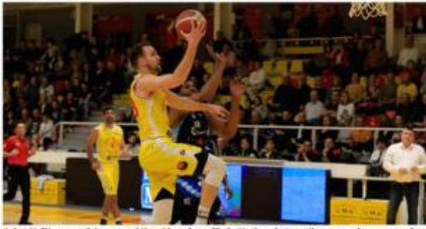
Saint-Vallier a parfaitement débuté les play-offs de Nationale 1 en s'imposant largement dans le Nord, sur le parquet de Loon-Plage, vendredi (65-101).