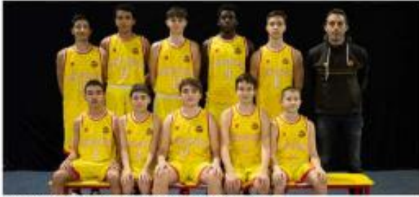
Les U15 du SVBD vont disputer la finale Drôme-Ardèche.

Le SVBD fête sa montée en Nationale 2 ce dimanche 28 avril de nombreuses animations sont prévues dont un derby avec un Tain Touren. Pour les autres sports, moins d'équipes sur le terrain à cause des vacances.