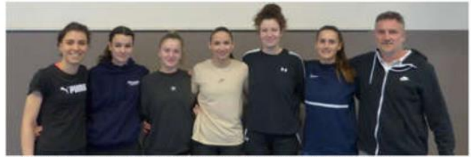
Un collectif aussi jeune que talentueux et prometteur.

Le collectif senior féminin du Vernosc Davézieux basket, en cette fin de saison, est en course pour monter de la R3 à la R2. Samedi 4 mai, les filles affronteront le leader Chambéry-La Motte-Cognin, en tête de poule.