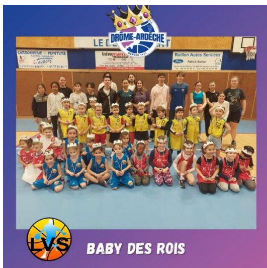
BABY DES ROIS

Nous remercions les clubs organisateurs et les clubs qui ont fait le déplacement malgré les problèmes de circulation. La convivialité, la bonne humeur étaient au rendez-vous et enfants comme parents sont repartis très contents de cette journée.