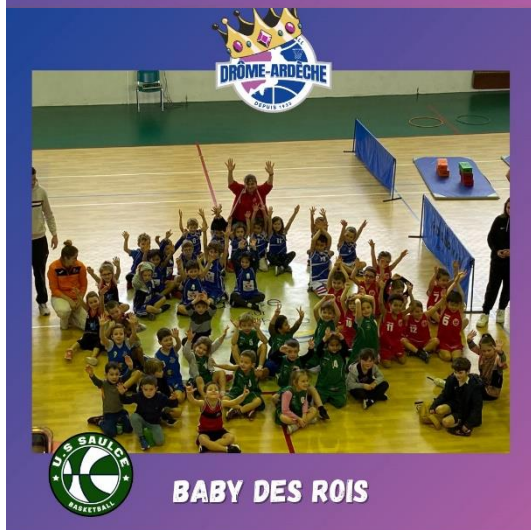
BABY DES ROIS