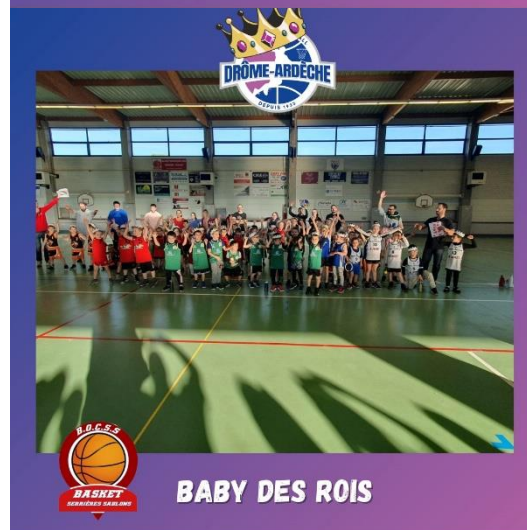
BABY DES ROIS