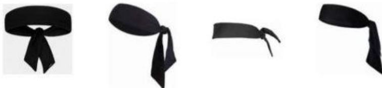
Figure 1 : Bandeau de tête de type bandana

Le port de bandeau de tête de type bandana (bandeau noué) n'est pas autorisé