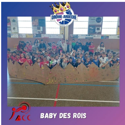
BABY DES ROIS

Ce weekend a eu lieu la traditionnelle fête des Babies des rois. 330 enfants de la catégorie U7 étaient réunis sur 5 sites, Avant Garde Tain Tournon Basket Club , US Saulce Basket , Bc Châteauneuf Sur Isère , La Voulte Sportif Basket , Basket Olympique Club Sablons-Serrières .