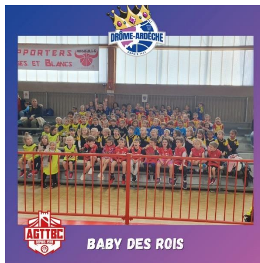
BABY DES ROIS